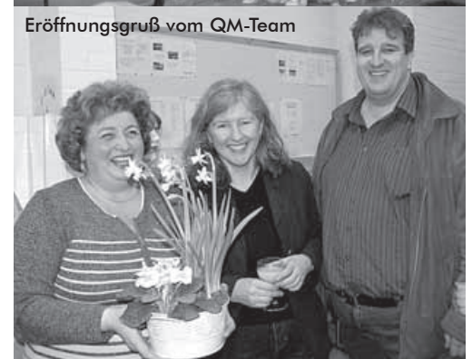
Eröffnungsgruß vom QM-Team