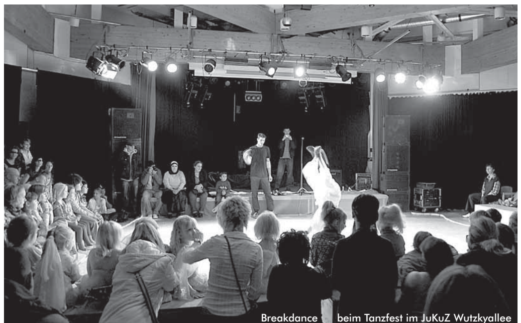
Breakdance beim Tanzfest im JuKuZ Wutzkyallee