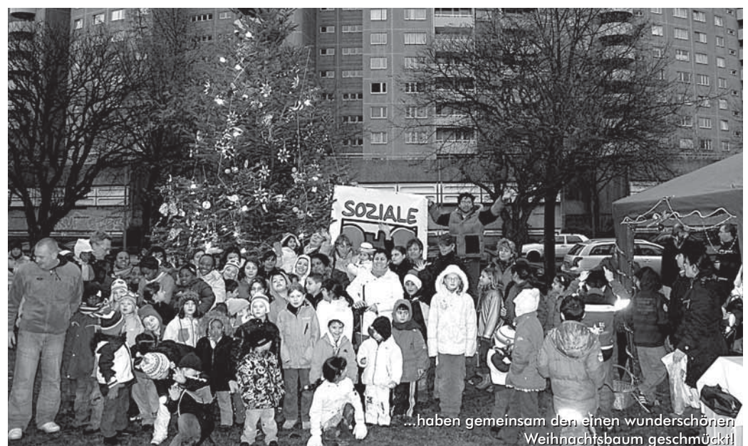
...haben gemeinsam den einen wunderschönen Weihnachtsbaum geschmückt!