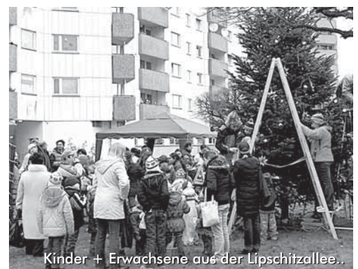
Kinder + Erwachsene aus der Lipschitzallee..