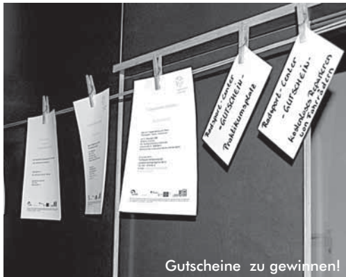
Gutscheine zu gewinnen!