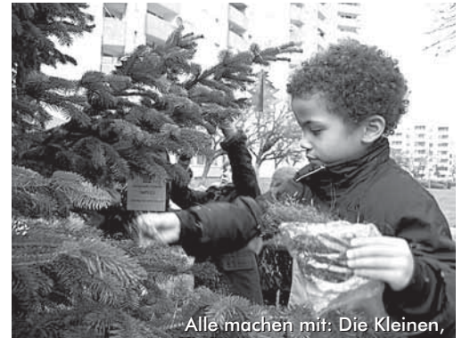
Alle machen mit: Die Kleinen,