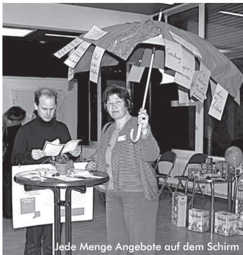
Jede Menge Angebote auf dem Schirm!

Nun werden noch die Spenden derjenigen Unternehmen per Würfelspiel vergeben, die heute nicht dabei sein konnten. Das ist ein so ernstes Vergnügen, dass immer mehr Anwesende mitmachen und die tollsten Preise einheimen. Besonders der Riesent Teddy hatte mehrere Liebhaberinnen, aber auch die Schulhefte gingen weg wie warme Semmeln. Heiterkeit aller Orten, Lob und Anerkennung für die gesamte Organisation und den angenehmen Rahmen bei Kaffee und Kuchen, natürlich selbst gebacken. Und dann läutet die große Schiffsglocke zum Abschluss.